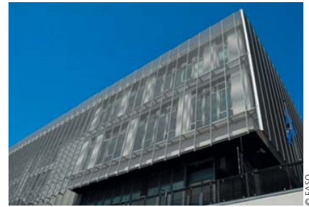
Sitz des EASO in Marsa, Malta Siège de l'EASO à Marsa, Malte

La participation au Bureau européen d'appui en matière d'asile (EASO) permet à la Suisse de renforcer le système de Dublin et de contribuer à un système d'asile plus efficace et plus juste en Europe. La signature prévue d'un accord au printemps entre la Suisse et l'Union européenne (UE) démontre une évolution positive dans ce dossier et marque un signe encourageant dans la poursuite de la collaboration, jusqu'ici déjà efficace, entre la Suisse et l'UE en matière d'asile.