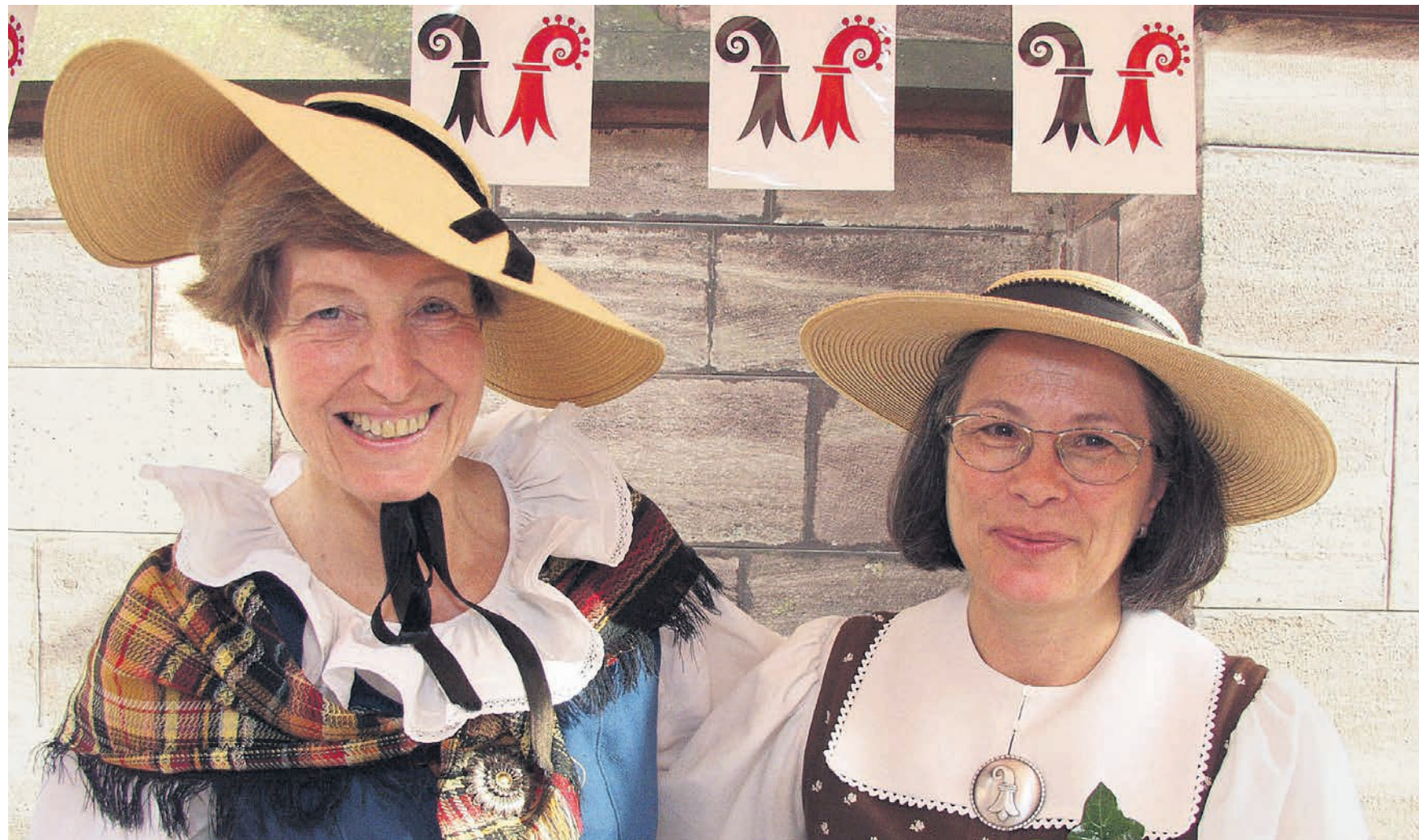
Verent. Eine Laufentalerin und eine Baslerin Arm in Arm – politisch ist das Verhältnis der Nordwestschweizer Regionen selten so harmonisch.